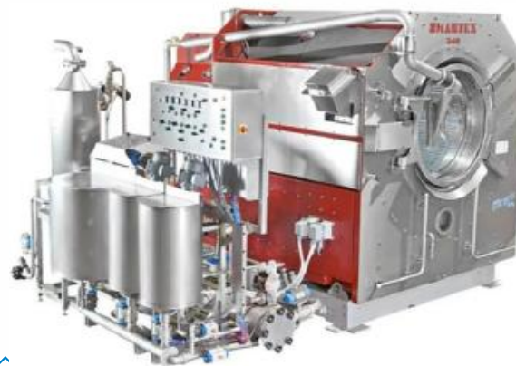
Imagen representativa del equipo