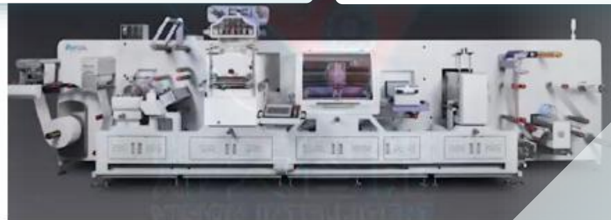
Fig. 1. Imagen Representativa Del Equipo